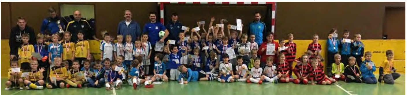
die Teilnehmer des U7-Turniers freuten sich nach der Siegerehrung über ihre Medaillen