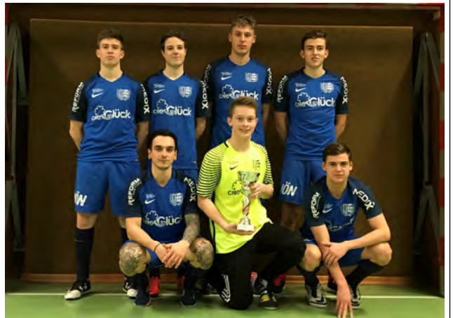
die Sieger des Turniers für Kampfmannschaften U23 St. Peter/Au