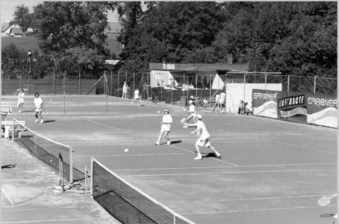
Die Anlage mit dem alten Clubhaus im Jahre 1995