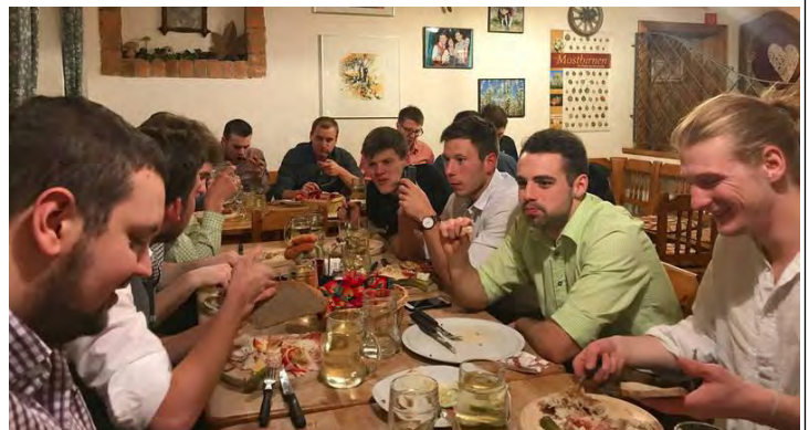
Nach einer harten und intensiven Vorbereitungszeit gab es zum Abschluss des Trainings-Wochenendes einen gemütlichen Abschluss beim Mostheurigen Hansbauer.