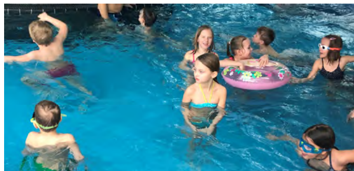
Im Hallenbad konnten sich die Kinder im Wasser austoben.