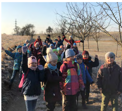
Trotz der Kälte draußen unterwegs ...