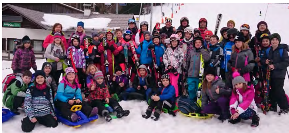
Kinder der Volksschule mit Lehrerinnen und Lehrern auf der Forsteralm.