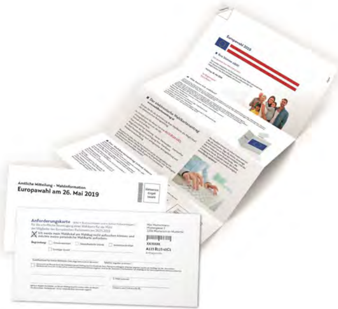
Abb.: Muster „Amtliche Wahlinformation – Europawahl“

Achten Sie daher bei all der Papierflut, die anlässlich der Wahl bundesweit (an einen Haushalt) zugesandt wird, besonders auf unsere Mitteilung (siehe Abbildung).