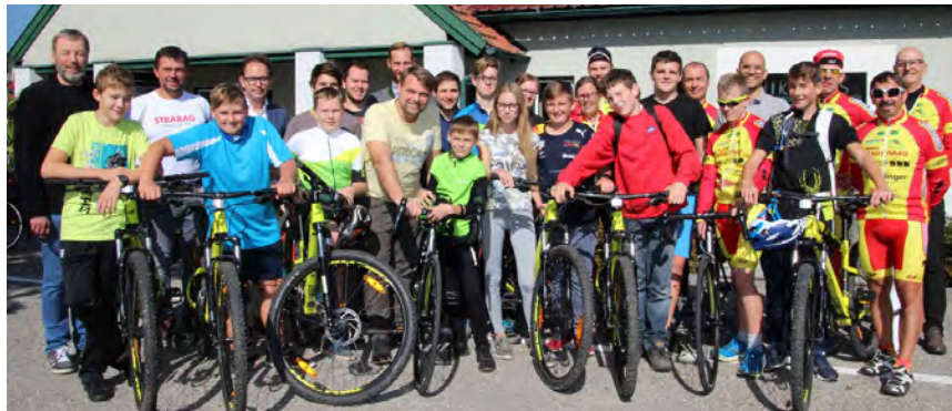
Teilnehmende und Sponsoren des Nachwuchsförderungsprogramms mit Radclub-Mitgliedern