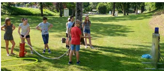
Österreichischer TRINK'WASSERTAG 2019. Weitere Fotos gibt es unter www.ff-stadthaag.at/aktuelles/ .

Der TRINK'WASSERTAG bot die Gelegenheit zu erfahren, welche vielfältigen Leistungen erforderlich sind, damit täglich bestes Wasser in ausreichender Menge in jedem Haushalt zur Verfügung steht. Die Besucher konnten viel über den Trinkwasserversorgungsbetrieb lernen.