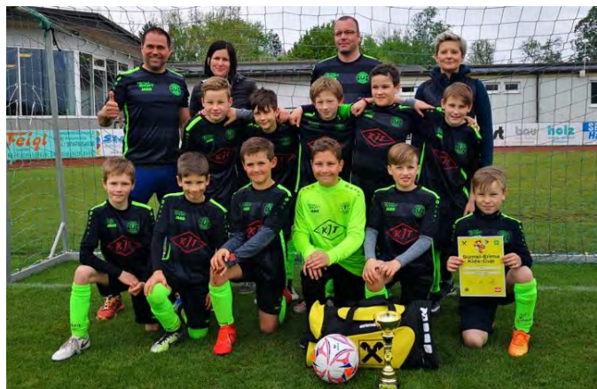
Sumsi Cup 2019