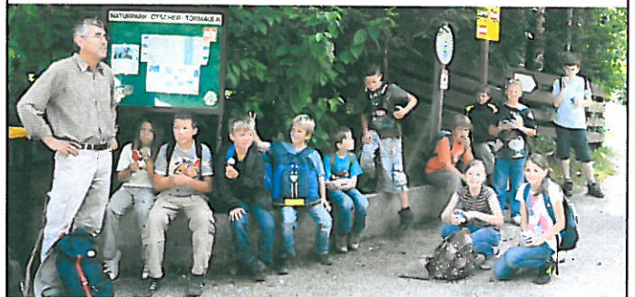
Teilnehmer der Tropfsteinhöhlen-Erlebniswanderung der Haager Naturfreunde, am Mittwoch, 28. Juli 2010 (2. Termin)

Unter www.stadthaag.at/ferienprogramm finden Sie die einzelnen Veranstaltungen als bleibende Erinnerung dokumentiert.