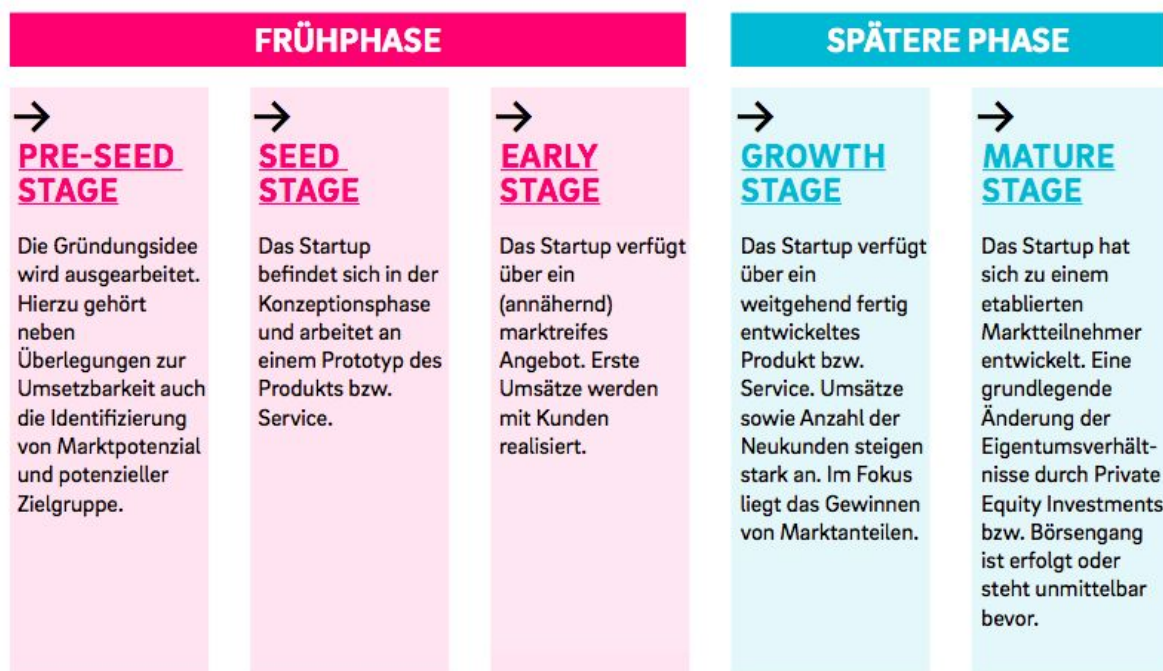
Abbildung 2: Lebenszyklus eines Startups; Quelle: Pioneers.io